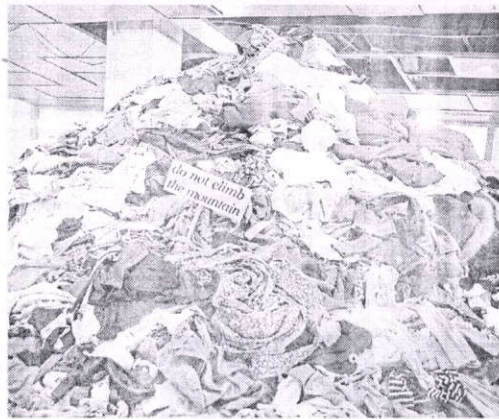
В России займется переработкой текстиля

Так, международная группа технологов работает над созданием бетона нового поколения из натуральных волокон, черного песка и стеклянных отходов. Ученые используют песок из отработанного стекла, а также экспериментируют с такими натуральными составляющими, как волокна китайской крапивы, бразильской агавы, конопли, джута и бамбука. Эксперименты показали, что включение всего лишь одного – двух процентов этих волокон позволяет бетону демонстрировать более высокую прочность на сжатие и растяжение и меньшую усадку при высыхании. Если технология будет внедрена, можно будет