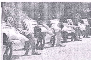
Дневной сон для японцев – норма

Культура труда Страны восходящего солнца весьма уникальна. С детства японцам внушают, что все наделены равными способностями и, если много трудиться, можно их развить. Отсюда родились явления «дзанге» и «инзумури». Дзанге – это переработки, которые для японцев считаются нормой. В связи с этим разрешен инзумури – короткий сон прямо на рабочем месте.