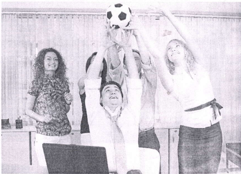
Внедрение спортивных инициатив может стать одним из компонентов программы по укреплению здоровья работников

Решением проблемы может стать внедрение модельных кор-