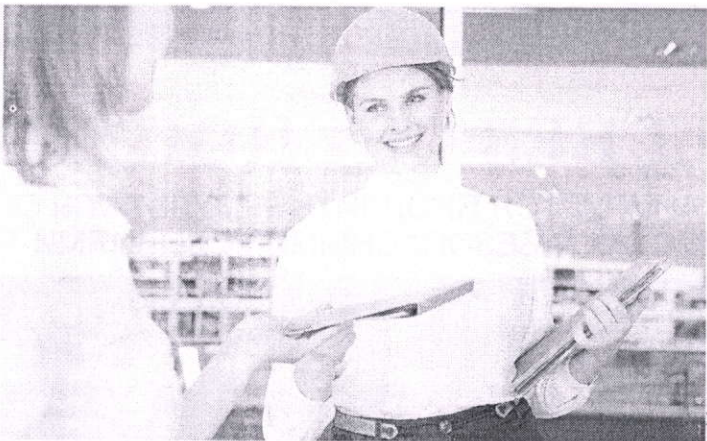
Пора повысить престиж специалиста по охране труда

В России хотят ввести новый профессиональный праздник – День специалиста по охране труда. Если за предложенную инициативу в течение года проголосуют более 100 тысяч голосов, почетной датой станет 19 ноября.